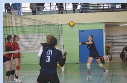
Album photos sur notre site Internet et sur notre page Facebook Vidéo set par set sur YouTube Volley-Ball La Rochette