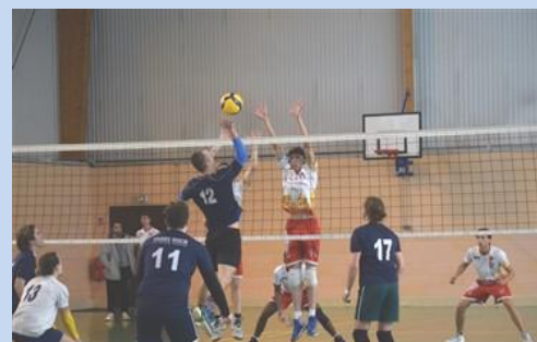
Album photos sur notre site Internet et sur notre page Facebook Vidéo set par set sur YouTube Volley-Ball La Rochette